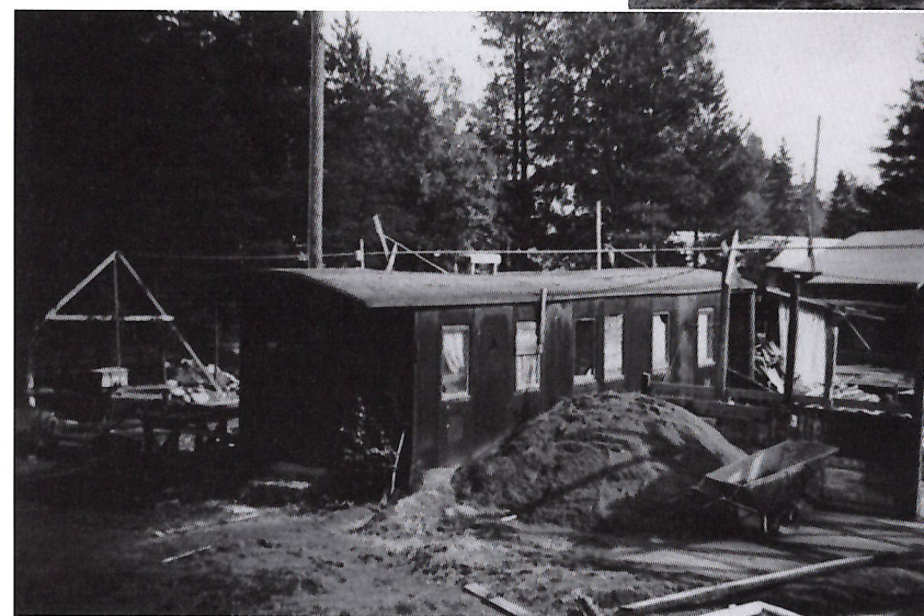
VR:n kolmannen luokan junavaunu oli toimitilana Puistokulman tontilla kymmenen vuotta.

T oisen maailmansodan jälkeen kommunistit saivat toimintaoikeutensa ja Suomen kansan demokraattinen liitto (SKDL) perustettiin vuonna 1945. Suurin osa työväenyhdistysten varallisuudesta oli sosialidemokraateilla, usein myös