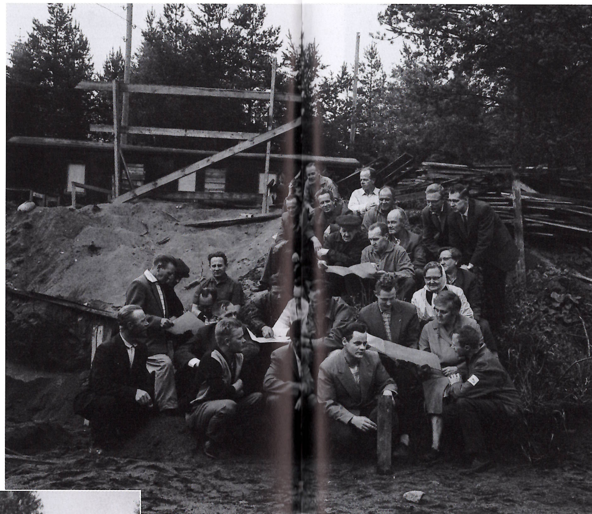
Talkooväkeä kokoontuneena ryhmäkuvaan.

kuntalaisten äänistä ja eduskuntavaaleissa yli kolmanneksen annetuista äänistä, 34,2 prosenttia vuonna 1958.